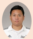
ゆうすけコーチ ダイヤモンドサッカー ジュニアコーチ